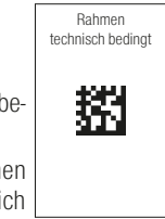
Rahmen technisch bedingt